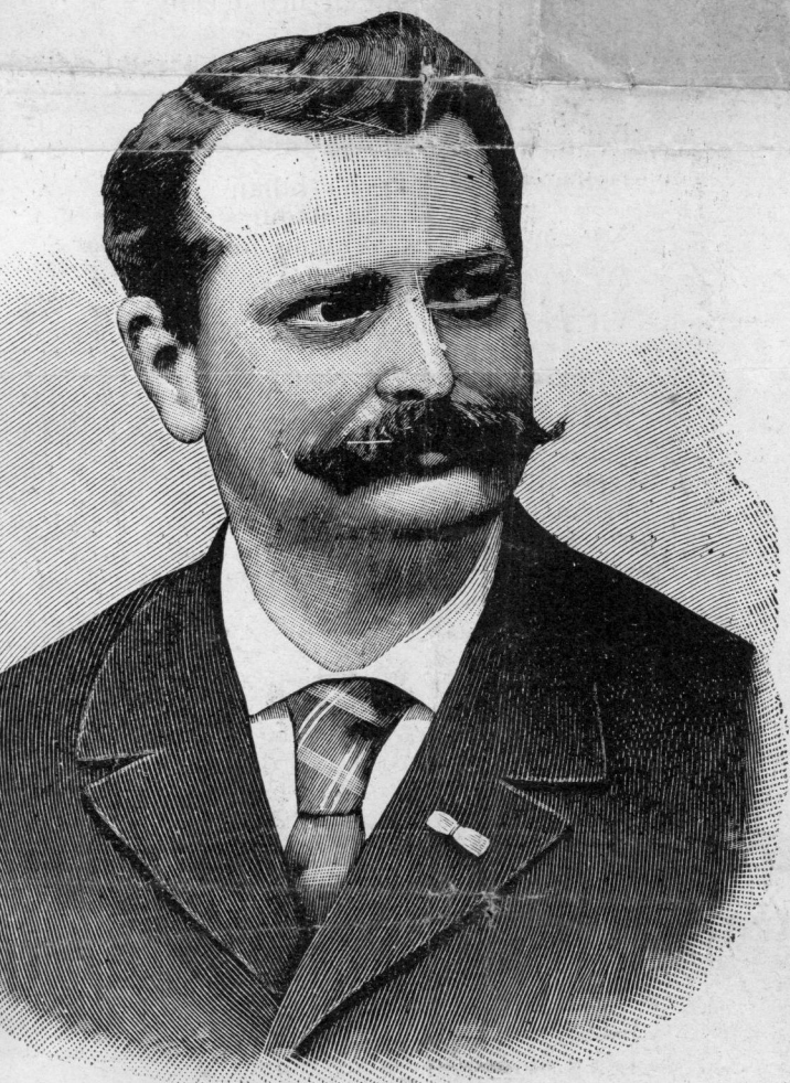
Markiz ESTOURBEILLON Broerek Kannad Gwened (Rener Kevredigez Broaduz Breiz)