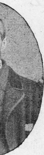
PROUX Marvet er bloaz 1863 (Kerne)