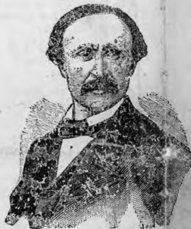
FANCH AN UHEL

Penn-Skrivagner AR BOBL hag AR VRO (Ar Bourc'hiz Iorc'hus ; Pontkallek, Barzaz Taldir)