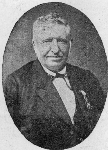
ERWAN HERNOT Marvet er bloaz 1900 (Gwerziou ha Soniou)